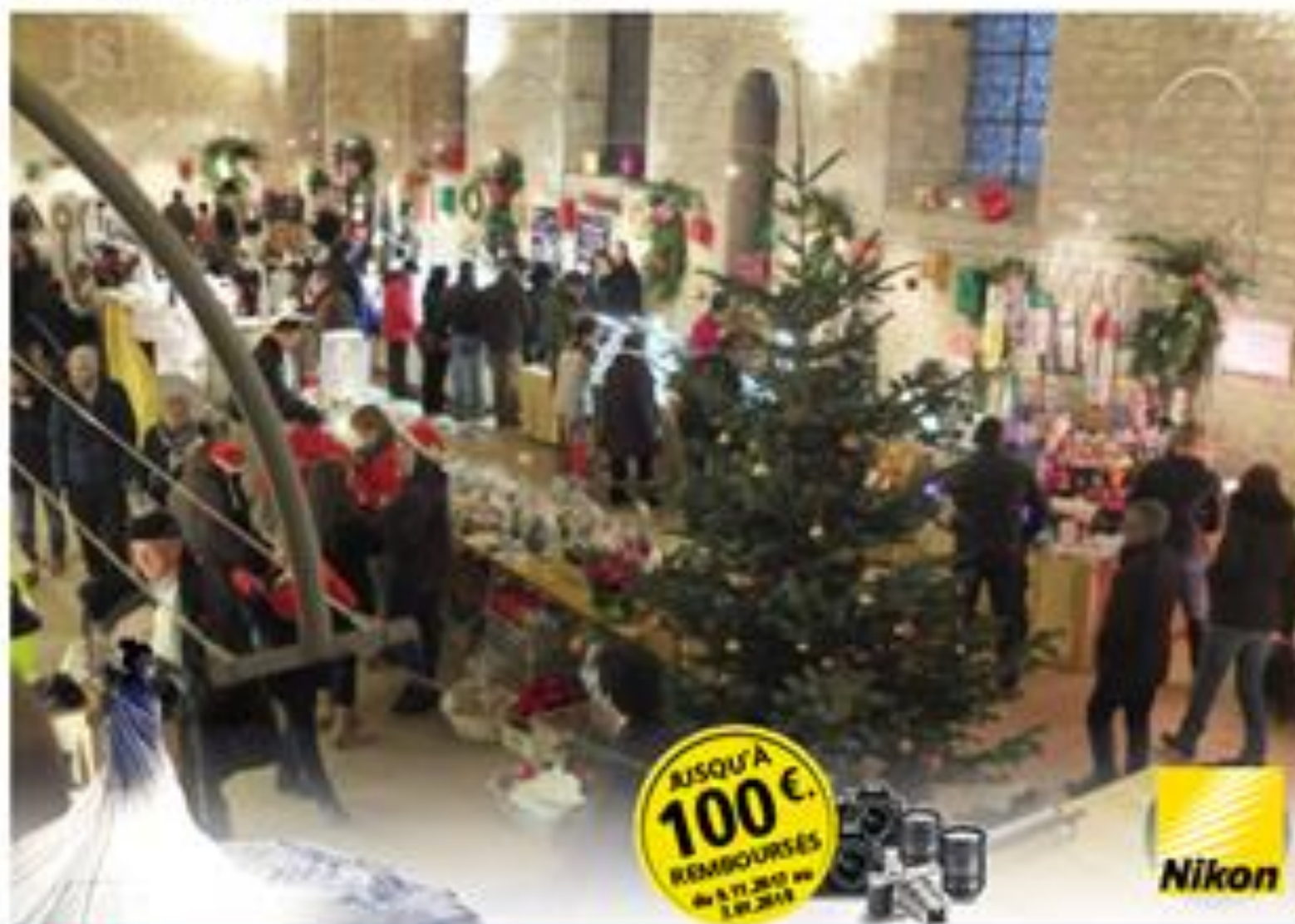
Le réfectoire accueille les artisans

Vu 775 fois | Le 17/12/2017 à 10:00 | Réagir