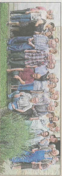
■ Les clubs se retrouvent tous les ans en alternance.

Depuis des années, les clubs des aînés de La Salle et de Saint-Albain se rencontrent pour un après-midi sympathique, où règne un grand bonheur de se revoir. Jeudi, les adhérents étaient 40 à Saint-Albain réunis pour une cause commune, une solide amitié.