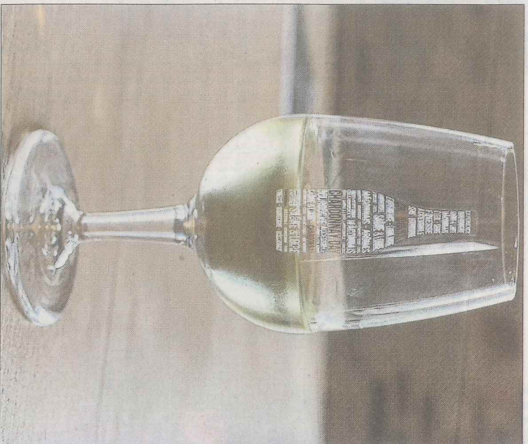
■ Un verre sérigraphié de l'événement sera remis à chaque visiteur.

Avec ses quelque 200 000 hectares, le chardonnay est le deuxième cépage blanc le plus planté au monde, soit 4 % du vignoble mondial pour environ 10 millions d'hectolitres. Et, accessoirement, un nom extrêmement connu à tel point qu'en 2010, des négociants californiens, soucieux de valoriser et de communiquer autour du cépage, lui ont consacré une fête : le Chardonnay Day. Il ne manquait plus qu'à Chardonnay, berceau du cépage, de s'approcher à son tour cette célébration. Ne pouvant pas passer à côté d'un tel événement, la commune, avec le soutien de