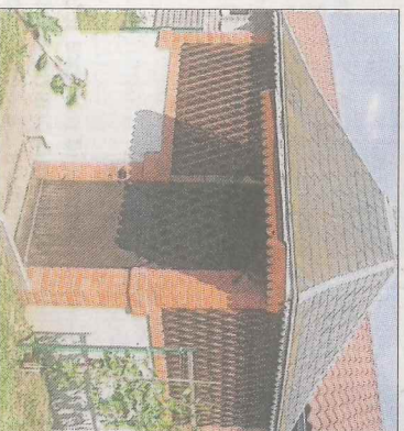
■ Le pavillon aujourd'hui.