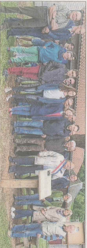
■ Il y avait du monde à l'inauguration du Pavillon samedi.

Dans le quartier du Terrilot, profondément transformé lors de la dernière décennie, il subsiste un témoin de l'époque où jardins et espaces verts occupaient le terrain. Lors de la construction de la nouvelle gendarmerie, la municipalité a décidé de préserver et réhabiliter cette construction originale, qui se trouve à ce jour inclus dans un espace de détente avec pelouse, bassin et table de pique-nique.